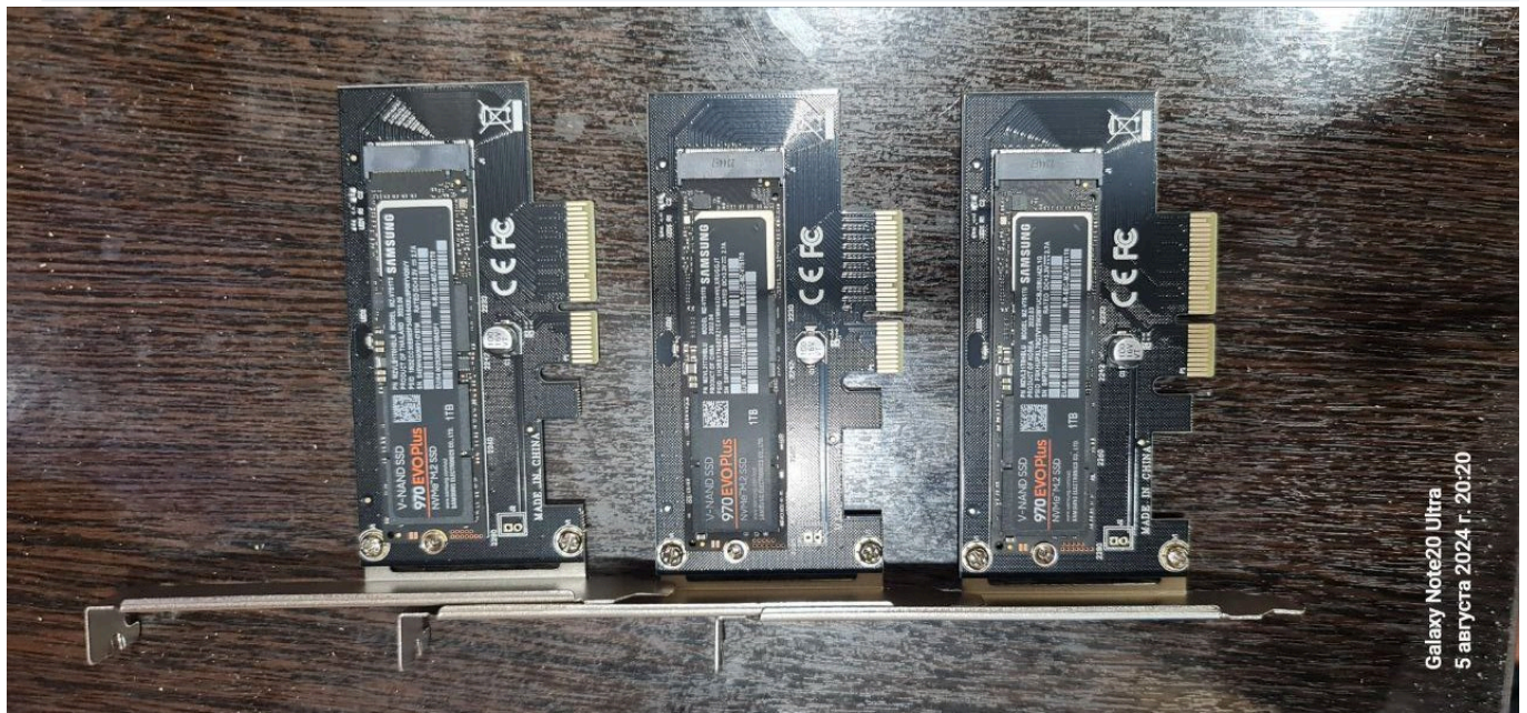
Galaxy Note20 Ultra 5 августа 2024 г. 20:20